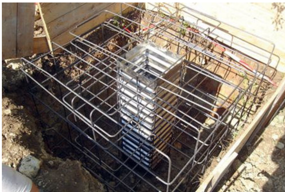
Bewehrungskorb für das Flutlichtmastfundament.

» Zentrales Stadionwelt-Stadien Stadionwelt-Arenen Impressum Kontakt