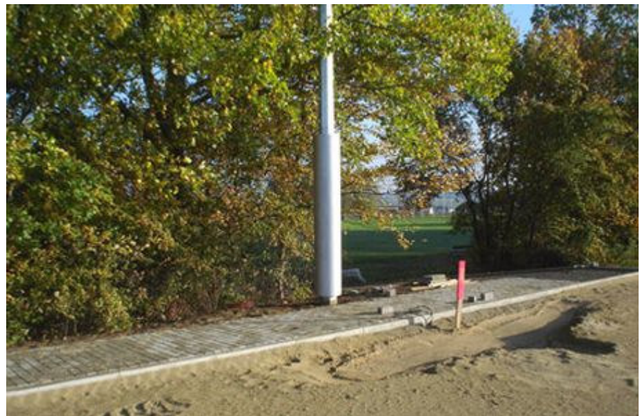
Flutlichtmast mit Berührungsspannungsschutz (äußerer Blitzschutz).